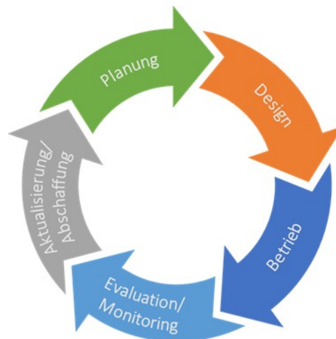
Abbildung 3: Richtlinien-Lebenszyklus COBIT 5

Zur Erstellung, fortlaufenden Überprüfung und bedarfsbezogenen Weiterentwicklung der in diesem Dokument dargelegten Architekturvorgaben wird der im Governance Framework COBIT 5 115 definierte Richtlinien-Lebenszyklus herangezogen. COBIT 5 wird innerhalb des TOGAF Frameworks als Referenzwerk für IT-Governance genutzt, da es einen offenen Standard zur Steuerung der IT darstellt. Der Richtlinien-Lebenszyklus dieser Architekturrichtlinie orientiert sich an den in der folgenden