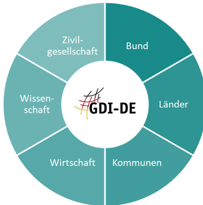
Abbildung 3: Akteure der GDI-DE

In der GDI-DE arbeiten Bund, Länder und Kommunen eng zusammen. Sie werden hierbei durch Wirtschaft, Wissenschaft und Zivilgesellschaft unterstützt. Gemeinsam tragen sie nach dem folgenden Rollenverständnis zur Erfüllung der Aufgaben bei. Entscheidend für ein erfolgreiches arbeitsteiliges Zusammenwirken sind das Bewusstsein und die Akzeptanz der unterschiedlichen Voraussetzungen und Interessen der Akteure der GDI-DE.