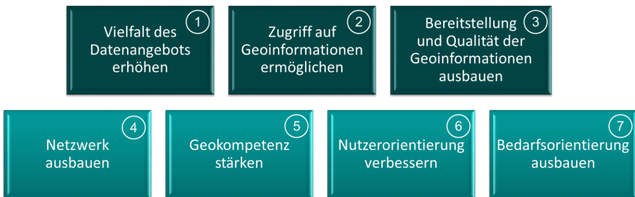
Abbildung 1: Übersicht der Schwerpunkte

Aus diesem übergeordneten Ziel der NGIS 2.0 sind die folgenden sieben Schwerpunkte abgeleitet, die mit konkreten Handlungsfeldern unterlegt werden. Sie umfassen technische Aspekte (Schwerpunkte 1 – 3) sowie organisatorische Aspekte (Schwerpunkte 4 – 7).